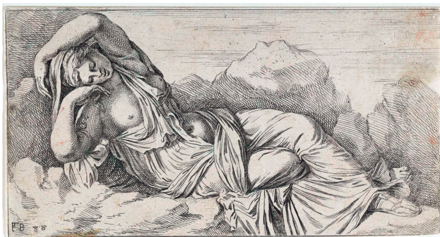
François Perrier, Cleopatra del Vaticano , 1638

Dejemos de lado, en este conjunto, los retratos y relieves decorativos, prescindamos incluso de muchas cabezas y figuras ideales, citemos de pasada alguna personificación, como la del grandioso Hipno , el Sueño (E-89), y centrémonos en las obras que aquí nos interesan: las que aluden a algún mito. En algún caso, la referencia es distante, o se limita a un mero atributo: así, la égida que protege a nuestras Ateneas (E-24, E-47) recuerda el momento en que Zeus regaló a su hija esta coraza, y la réplica del Heracles «tipo Lansdowne» , de Escopas (E-108), concede particular importancia a la piel del león que este héroe mató en Nemea. Pero hay casos en que estos detalles son más elocuentes: así, merece un estudio concreto la Venus del delfín (nº 4), porque todo en ella evoca el mito de su nacimiento en las aguas del mar, y lo hace de forma más intensa que otras dos figuras con el mismo sentido: la llamada Venus de la concha (E-86) y la Venus Anadiomene de tipo rodio (E-33).