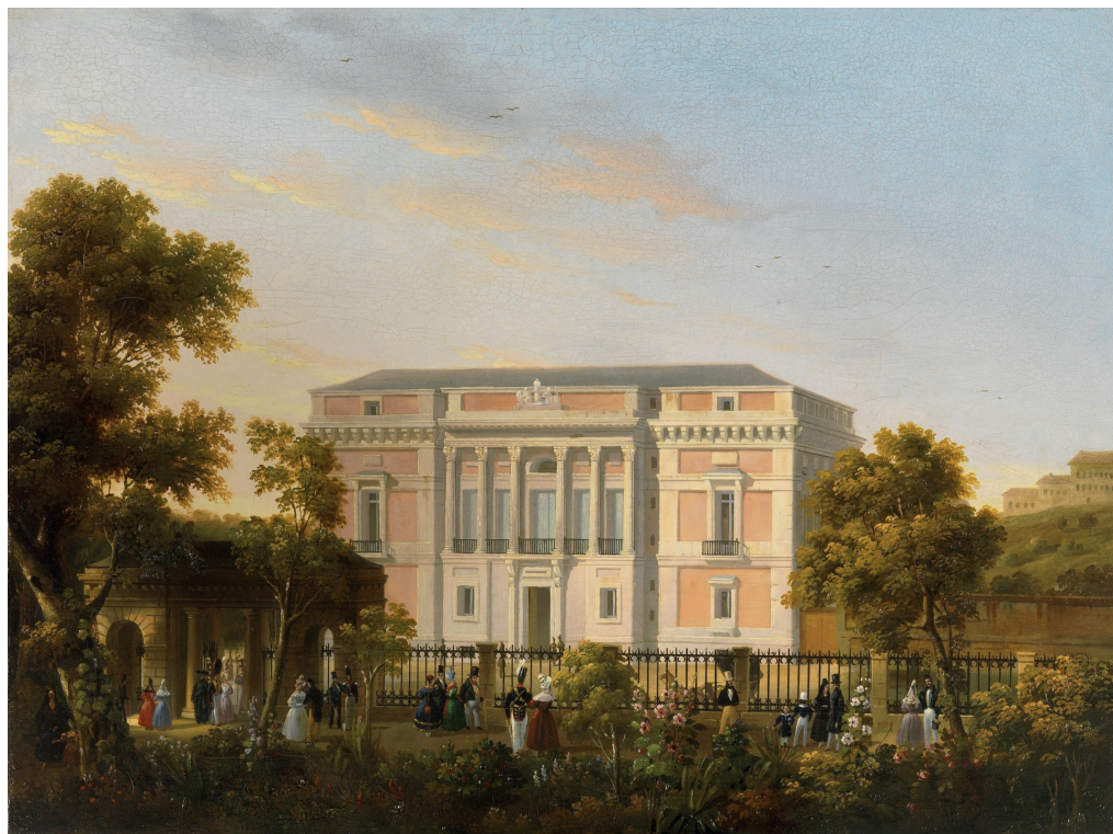
José María Avrial y Flores, Vista de la fachada sur del Museo del Prado , h. 1835. Madrid, Museo Nacional del Prado

para nuestros intereses: una importante colección de mármoles antiguos, y, sobre todo, un número impresionante de pinturas, realizadas en talleres de toda Europa, nos invitan a sumergirnos en el mundo fascinante de los relatos míticos, recordándolos, observando sus variantes, analizando los modelos que cada autor siguió, apreciando, caso por caso, el respeto a las tradiciones o la creatividad de los pinceles más prestigiosos. Incluso podemos plantearnos el porqué de la elección de un tema, su significado concreto en una época o el sentido de un encargo muy puntual.